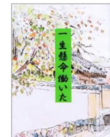
*写真は作品例です

主催：NPO法人シニアわーくすRyoma21 http://www.ryoma21.jp/ 「ききがきすと」専用サイト http://kikigakist.ryoma21.jp/ お申込み・問い合わせは：info@ryoma21.jp (mail) または TEL 03-5537-6790 FAX 03-5537-5281